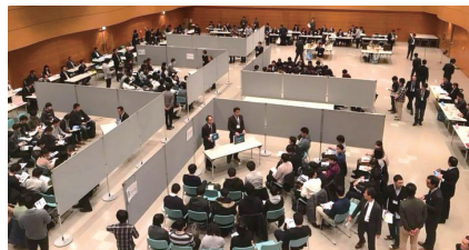
交流会会場の様子。冊子「東北を支える建設関連企業図鑑」を配布。