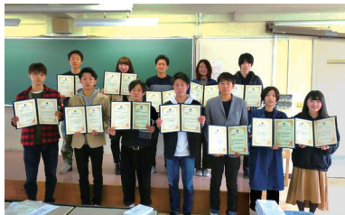
卒業式での尚建表彰の様子。奨励賞は2年次成績優秀者に授与されます。