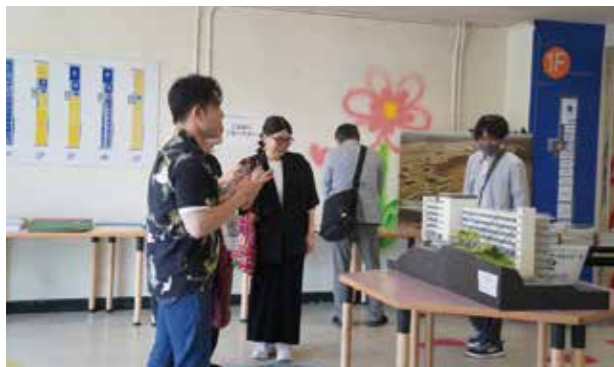
5号館見学会の様子

5号館解体に先立ちまして、6月29日の60周年記念事業の一環として、5号館の見学会が催されました。同日、当同窓会でも、5号館の見学を終えた6地域支部の皆様12名にご参加いただき、地域支部との意見交換会・懇談会を開催し、各地域での会員の発掘と活発な活動を申し合わせました。特に、東