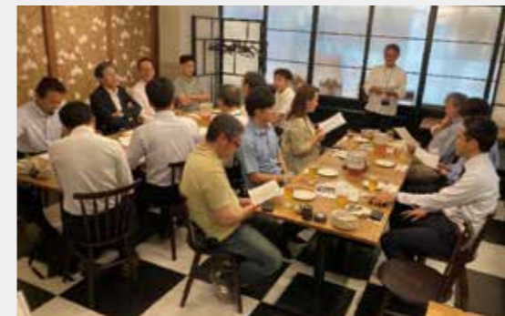
プロフェッショナル論 講師・教員懇親会

今後とも全学同窓会の支援をいただきながら尚建会が学生さんと卒業生、教員と卒業生、卒業生同士、ひいては大学と社会を繋ぐ役割を担っていく事を目標に活動を続けてまいります。