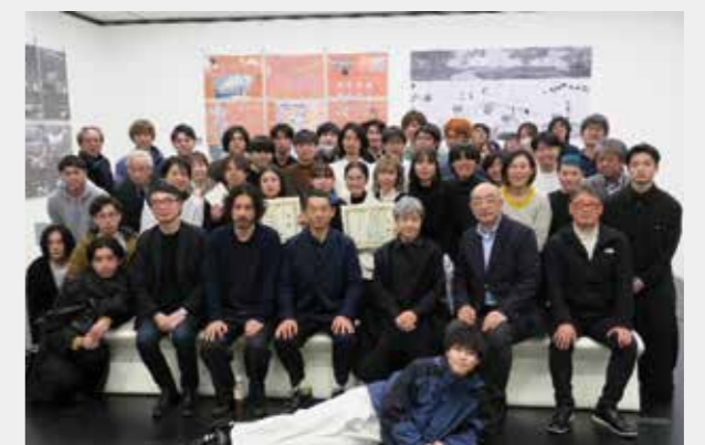
卒業設計審査会（尚建会大賞・尚建会賞）