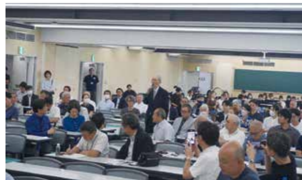
ホームカミングデーセレモニー