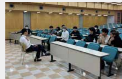
プロフェッショナル論イントーク