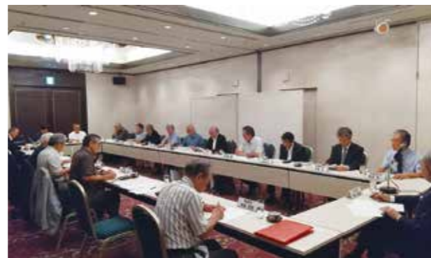
ホームカミングデー及び地域支部との意見交換会

末文になりますが、東北工業大学の益々のご発展と会員皆様のご健勝をお祈り申し上げ、「工大人」発刊に当たってのご挨拶とさせていただきます。